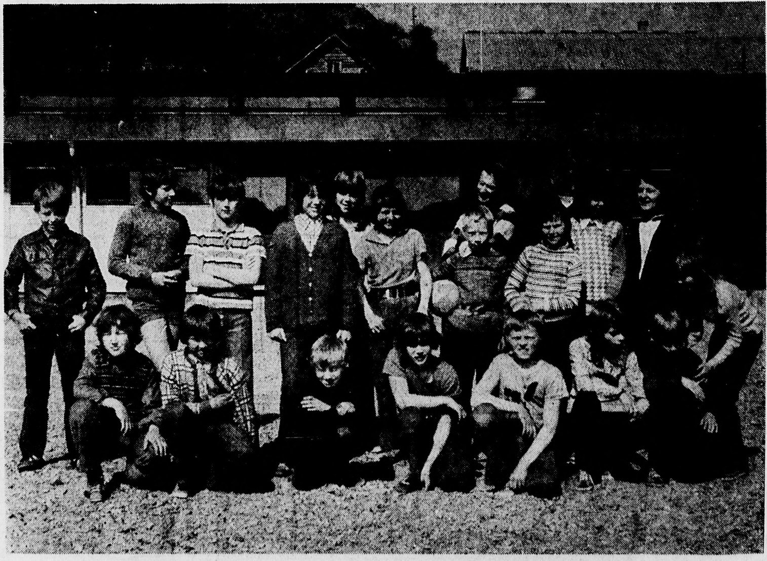
Dei er skuleungdommane på Goddo. Dei har fått ny skule, og når brua no er opna ser dei ei ny framtid i møte.