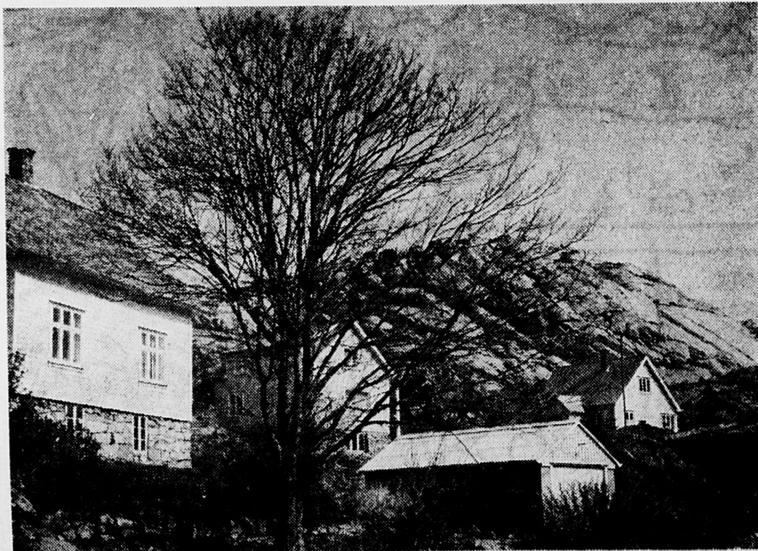
Desse tre husa står tome. Det bur ikkje folk lenger på denne staden — Klåven.